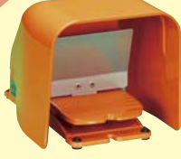
ロック機構付 フットスイッチ