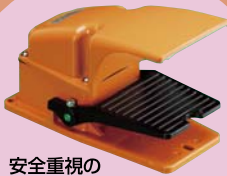
安全重視の 3ポジションフットスイッチ