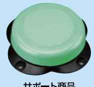
サポート商品 入力支援スイッチ